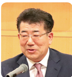
来賓 館 静馬 県議会議長