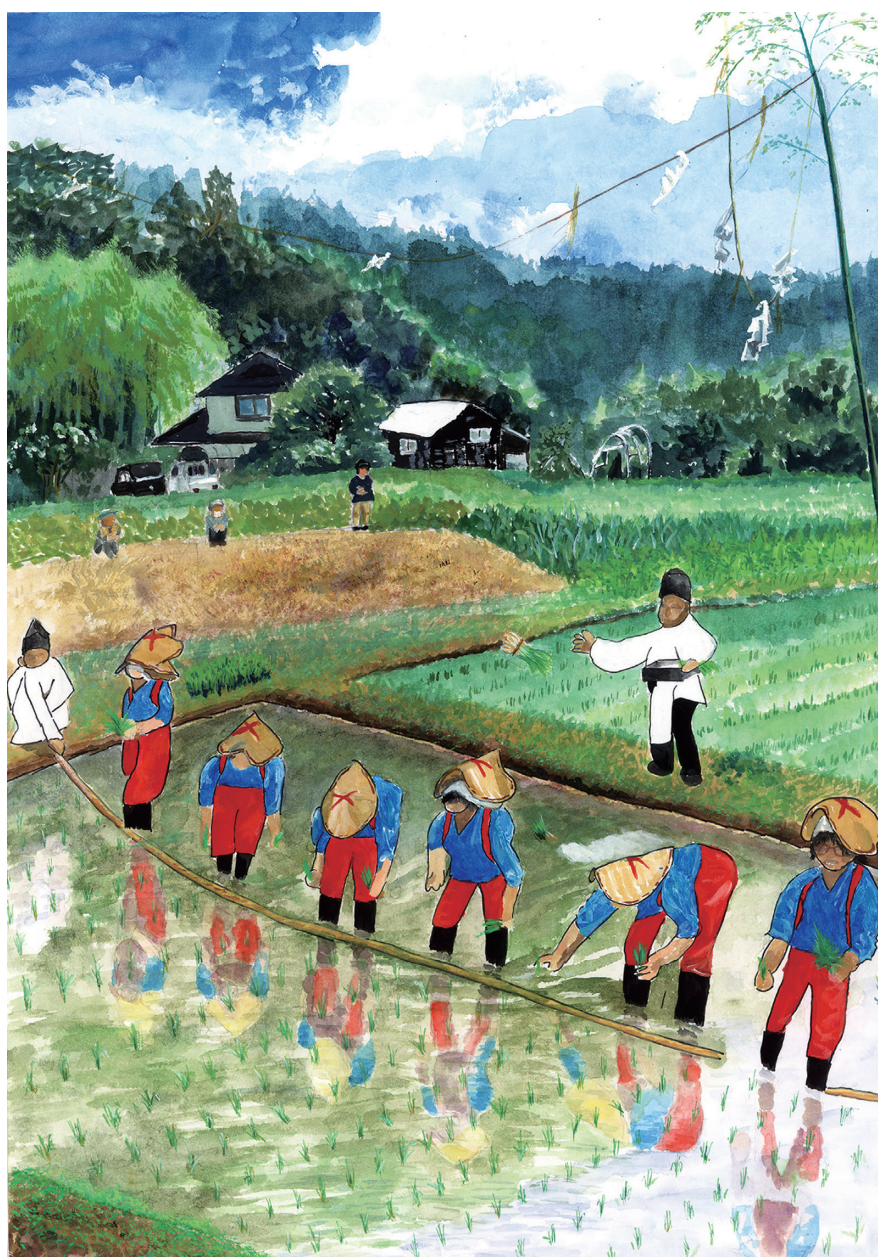
第17回いばらきの農業・農村子ども絵画コンクール入賞作品 茨城県土地改良事業団体連合会長賞