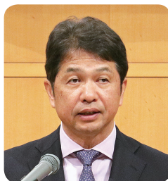
来賓 大井川和彦 茨城県知事