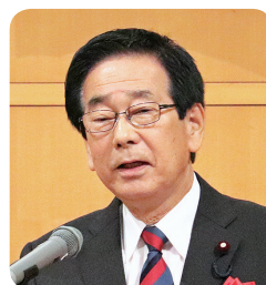
来賓 田所 嘉徳 衆議院議員