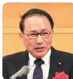
来賓 葉梨 康弘 衆議院議員