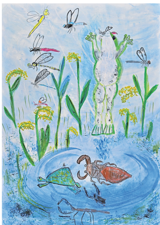
「田んぼから生命が誕生する」