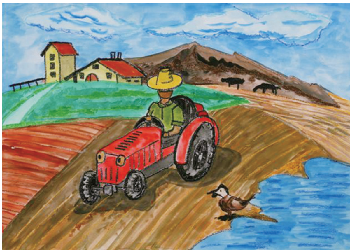
第1回大好きいばらきミドリ（水土里）子ども絵画コンクール入賞作品 茨城県土地改良事業団体連合会長賞