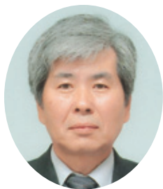
茨城県農林水産部 農地局長