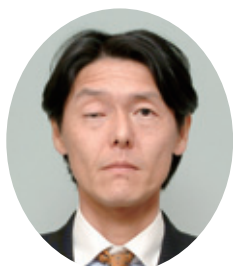
茨城県農林水産部長