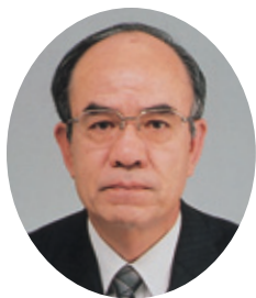
茨城県土地改良事業団体連合会 専務理事

今後とも、本県の農業農村整備事業の推進につきまして、皆様方のお一層のご支援、ご協力を賜りますとともに、益々のご活躍をお祈り申し上げます。新年度のご挨拶といたします。