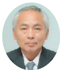
茨城県農林水産部技監 兼農地局農村計画課長