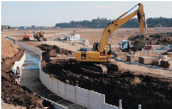
撮影場所：常陸大宮市