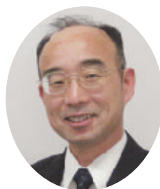
茨城県農林水産部農地局 農村環境課長

最後になりましたが、会員の皆様方のますますのご活躍とご発展を祈念申し上げまして、就任のご挨拶とさせていただきます。