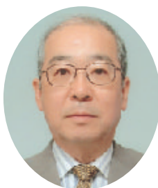
茨城県農林水産部長