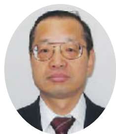
茨城県農林水産部農地局 農地整備課長

最後になりましたが、会員の皆様のご健勝とご活躍を心からご祈念いたしましてご挨拶といたします。