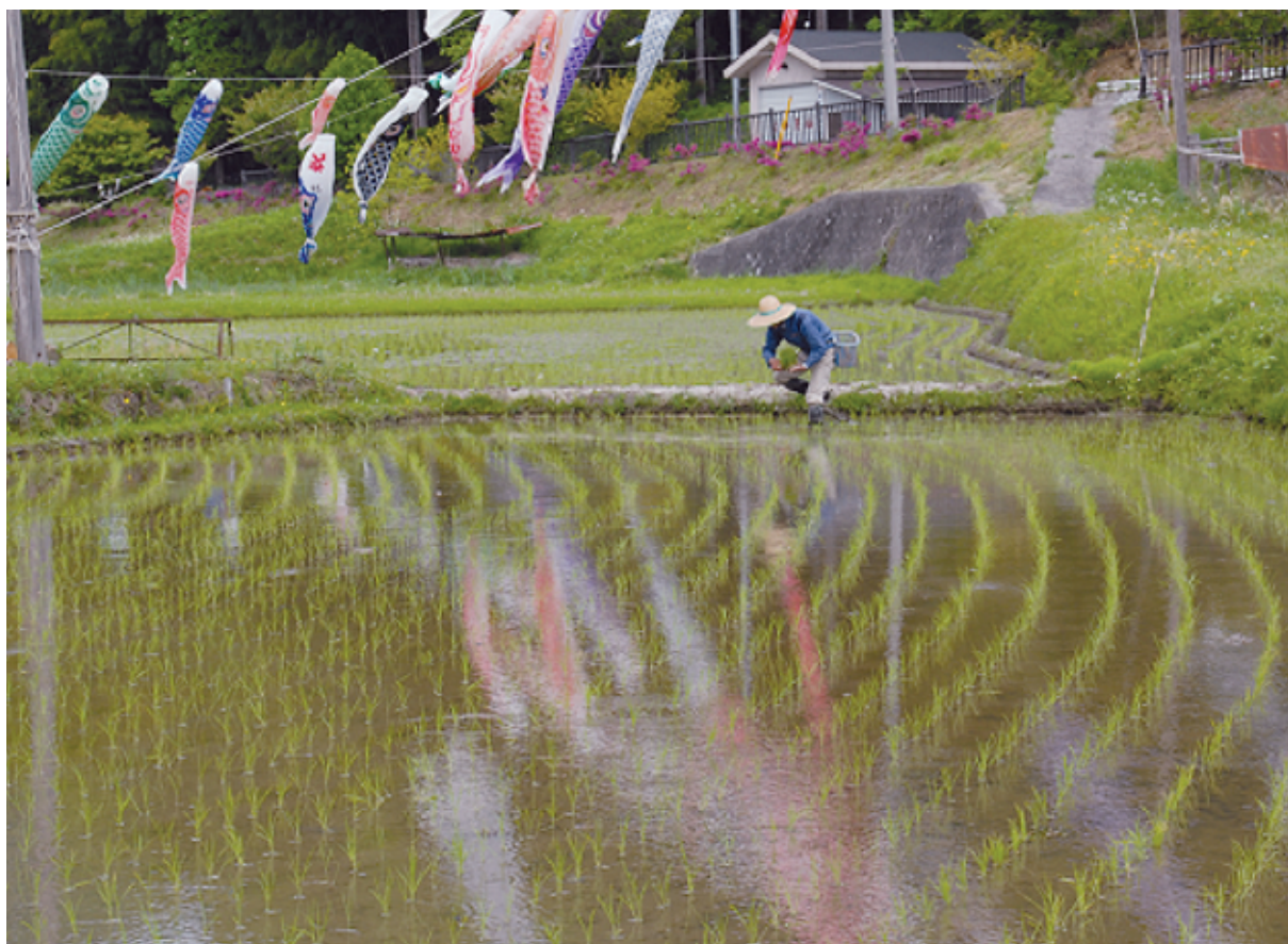
「早苗の頃」 (撮影場所／大子町) 第13回大好きいばらき農業農村フォトコンテスト入賞作品 優秀賞