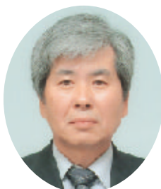
茨城県農林水産部 農地局長

この農業改革をさらに進展させていくため、農村の環境保全活動と環境にやさしい営農活動を地域ぐるみで一体的に進める「エコ農業茨城」の実施地区の拡大を図るとともに、これらの地区で採れたエコ農産物を県内外に積極的にPRし、本県農業・農村・農産物のイメージアップに努めてまいります。