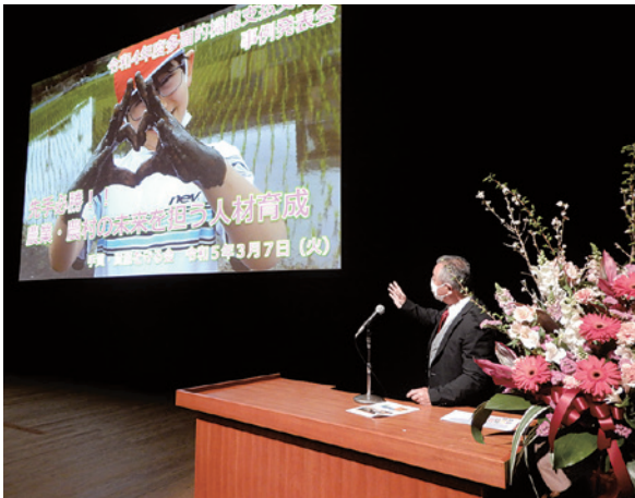
手賀・資源を守る会

去る3月7日（火）水戸市「ザ・ヒロサワ・シティ会館」において、茨城県ふるさと多面的機能推進協議会主催による優良活動事例発表会・機械の安全使用に関する研修会が、多面的機能支払活動組織、土地改良区職員、県職員、市町村職員等、約700名を参集し開催された。