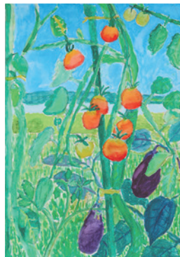
「おばあちゃんの畑」