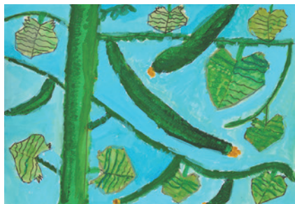
「わたしのきゅうり」