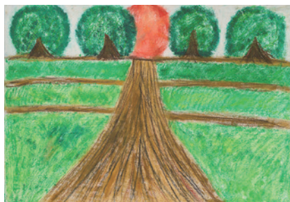
「どこまでもつづく」