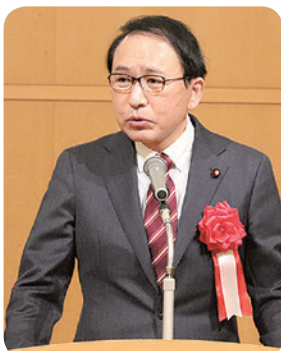
来賓 葉梨 康弘 衆議院議員