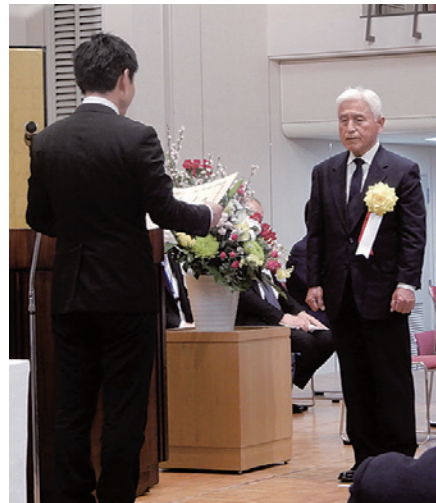
受賞した中崎組会長