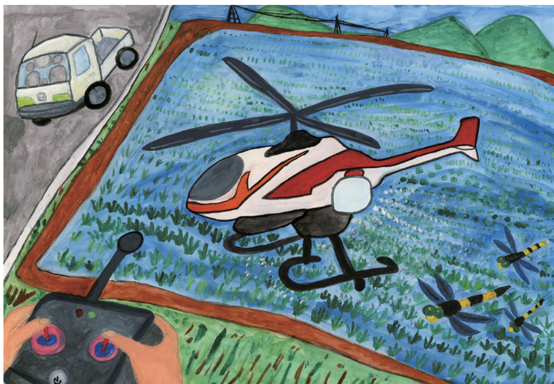
第14回いばらきの農業・農村子ども絵画コンクール入賞作品 茨城県土地改良事業団体連合会長賞