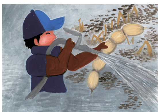
茨城県議会議長賞