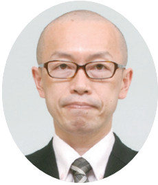
茨城県農林水産部長 上野 昌文

茨城県土地改良事業団体連合会及び会員の皆様には、日頃より本県の農業・農村の振興に多大なる御協力を賜り厚くお礼申し上げます。