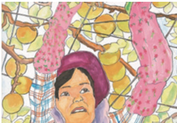
茨 城 県 知 事 賞