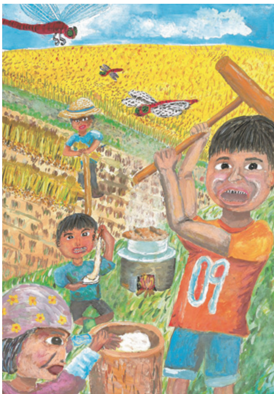
第9回大好きいばらきミドリン(水土里)子ども絵画コンクール入賞作品 茨城県土地改良事業団体連合会長賞