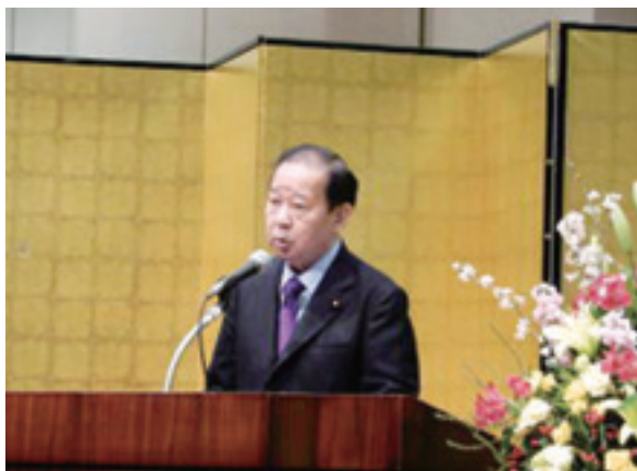
挨拶する二階俊博全土連会長

全国水土里ネット（全国土地改良事業団体連合会）の全国水土里ネット表彰式（第59回土地改良功労者等表彰式並びに農業農村整備優良地区コンクール表彰式）がさる3月26日、東京都千代田区平河町のシェーンバッハ・サボーにて開催された。