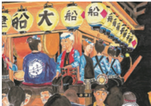
茨 城 県 議 会 議 長 賞