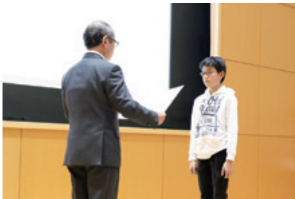
土連会長賞 受賞者

今回、茨城県土連会長賞に選ばれたのは、稲刈りの後で子供達が昔ながらの杵と臼で餅つきをしている様子を丁寧に描いた作品でした。最近では滅多に見られなくなった光景ですが、農作業を通して、貴重な体験を作品にしてくれたのは大変思い出に残る出来事になったと思います。