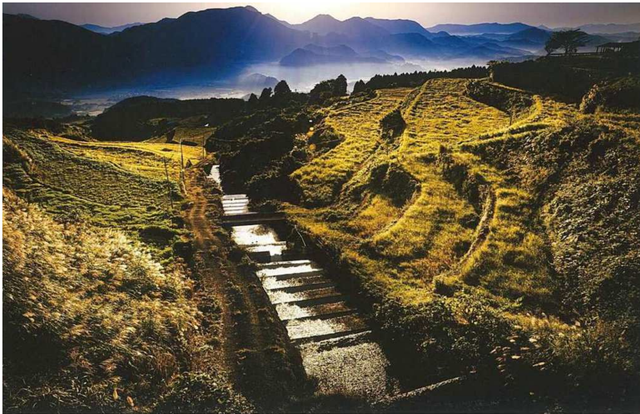
疏水部門2022最優秀賞『岳の棚田と朝霧』