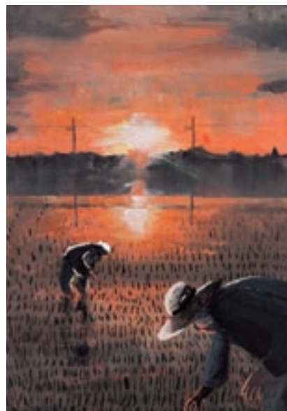
茨城県議会議長賞